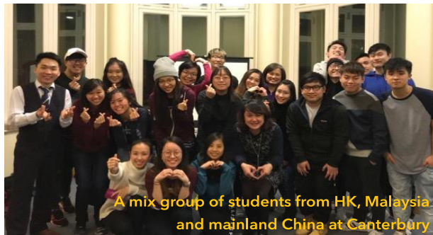
A mix group of students from HK, Malaysia and mainland China at Canterbury