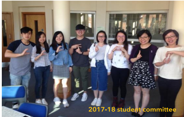
2017-18 student committee