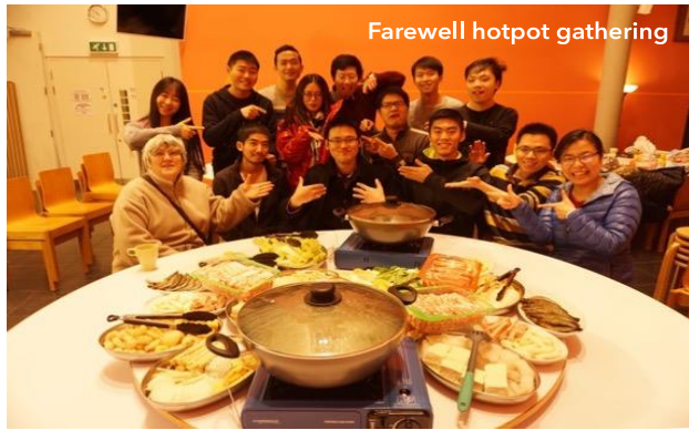
Farewell hotpot gathering