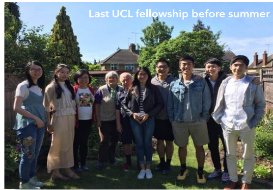
Last UCL fellowship before summer