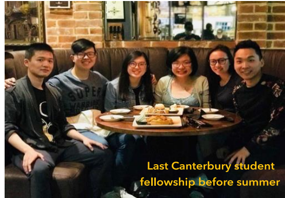
Last Canterbury student fellowship before summer

We thank God that we have a strong team to serve together at Canterbury Chinese Christian Church (yes - we changed our name from fellowship to church in June 2018!) We are especially grateful for a strong team of student leaders, who all have vision and passion to serve the Lord and reach out to their fellow students. Please pray for these young people. Some of them graduated this summer and some of them will stay for another year. Pray that God will raise up more young people to join the force and further God's kingdom in Canterbury. We also welcome a mix group of students from Hong Kong, Malaysia and mainland China gathering together to study the word of God. This year saw a girl from Malaysia coming to the Lord after her three-year study in Canterbury. She will later move to London to further her study, please pray that she will continue to seek the Lord and find a good church/fellowship.