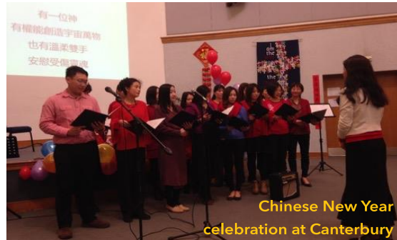
Chinese New Year celebration at Canterbury