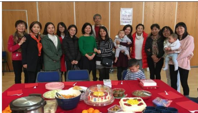
週二團契，服侍在家媽媽和陪讀母親，是個福音預工和傳福音的窗口。