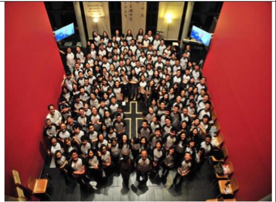
又有同學委身要走十架路，感謝主！