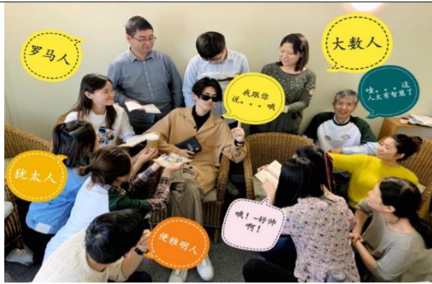
參加 COCM 總部今年的復活節學生栽培營會。從“使徒行傳”中學習做門徒。