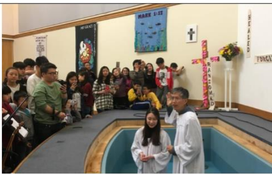
在宣教工場上有許多第一次，這是雲海第一次施洗。