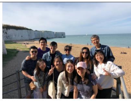
和學生同工們，暑假前到海邊鬆弛一下。