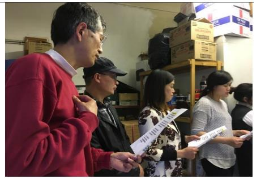
英國有一個很大的群體：餐飲業的華人。我們去到他們當中，以家庭婚姻和教養孩童為切入點傳福音，以及堅固基督徒。